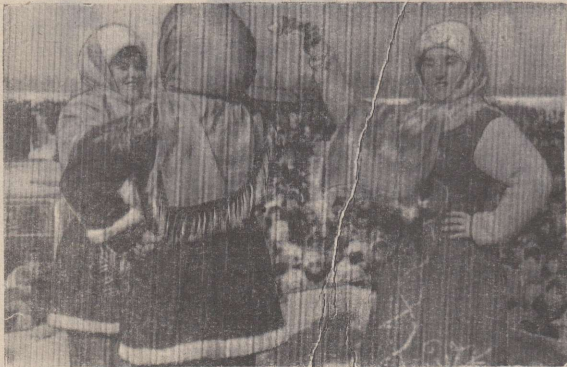
Нет ничего лучше русского танца!