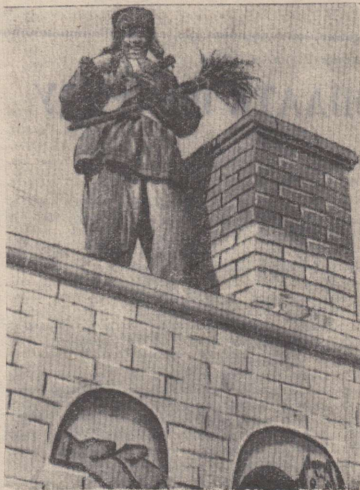
И балалайка и метла — все было у Емели.