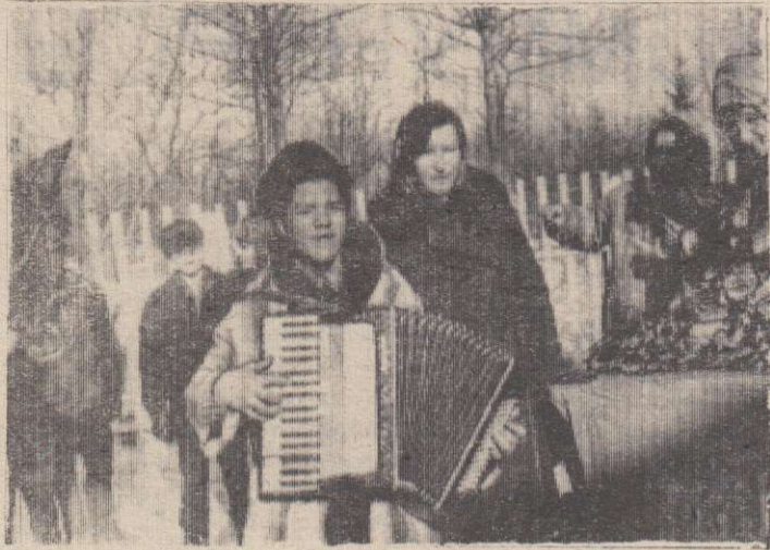
Какой же праздник без музыки!

Три неразлучных мушкетера. Баба-Яга в избушке на курьих ножках. Цыганский табор. Емеля на печке... Трудно перечислить всех тех героев сказок, литературных произведений, что собрались проводить зиму.